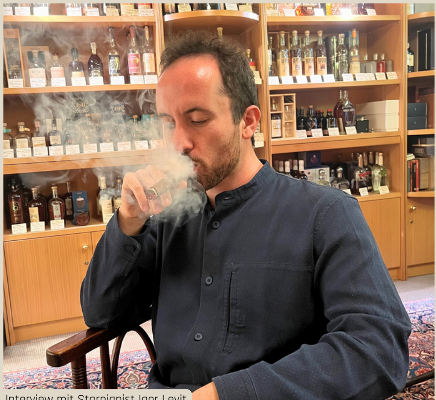
Interview mit Starpianist Igor Levit