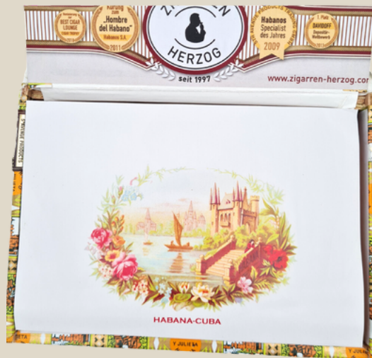
Die „Bofetón“ welche die Zigarren bedeckt

Das erste was einem ins Auge fällt, wenn man die Zigarrenkiste vor sich hat, ist die sog. „Cubierta“. Das große Motiv auf der oberen Deckelseite. In unserem Beispiel die berühmte Balkonszene von Romeo und Julia. Eingerahmt wird diese von der „Filete“. Ein schmales Band, welches rankenartig über den Kanten der Kiste liegt und ein wiederholendes Muster aufweist. An den Seiten der Kiste befindet sich die „Costero“. Sie ist auf beiden Seiten identisch und gibt Auskunft über das Zigarrenformat bzw. die Verkaufsbezeichnung (vitola de salida). Die schmale Vorder- und Rückseite heißt „Laguero“ und gibt dem Aficionado Informationen über Marke, Zigarre und die Anzahl der Zigarren in der Kiste. Sobald die Kiste aufgemacht wird erscheinen zwei neue Flächen. In der Deckelinnenseite befindet sich die „Vista“, welche häufig das Motiv der Deckeloberseite (Cubierta) spiegelt und vergrößert darstellt. Das feine Papier, welches die Zigarren überdeckt nennt sich „Bofetón“.