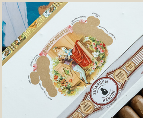
Die „Vista“ einer Romeo y Julieta Belicosos Kiste

Der Ursprung dieser Kistenverpackung geht auf die Mitte des 19. Jahrhunderts zurück und diente zum einen der Verkaufsförderung der Zigarrenmarken und war zum anderen ein Experimentierfeld für die damals boomende Lithographietechnik Kubas, welche unzählige Spielarten für Zigarrenringe und Kistenausstattung hervorgebracht hat. Bis in die 1920er Jahre wurde mit Lithographiesteinen und teilweise echtem Gold (wie bei Romeo y Julieta) gearbeitet. Danach setzten sich moderne Druckverfahren durch, da sie schneller und günstiger druckten.