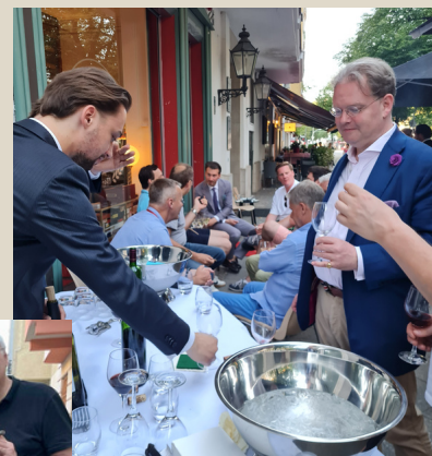
Die Nachbarn von Zigarren Herzog am Gericht

Über die zahlreichen Glückwünsche haben wir uns sehr gefreut und danken allen Gästen für Ihr Kommen und Wiederkommen.