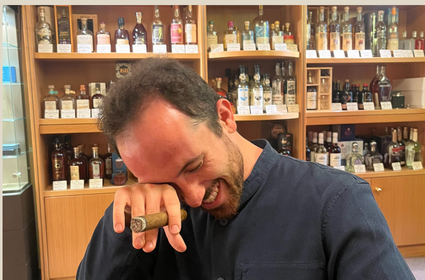
Igor Levit Pianist und Zigarren Aficionado