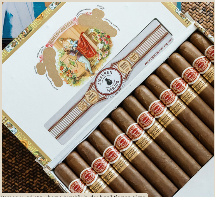
Romeo y Julieta Short Churchill in der habilitierten Kiste