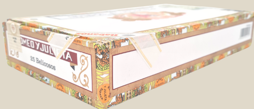
Die „Filete“ aus der sich wiederholenden Balkonszene